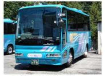
4列21人乗りサロン車