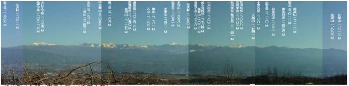
松川町から望む南アルプス(赤石山脈) (上段: 南アルプスの山々、中段: 前山の山々、下段: 伊豆山地の山々)