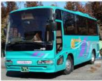
4列20人乗りサロン車

貸切バス事業 一般貸切、各種送迎 小さなグループから団体旅行まで 旅のガイド付、地域観光案内 旅行事業 海外旅行、国内旅行 一度行ってみたいかった話題の観光地 ご希望に応じたコースの企画・見積と 手配・ご案内をさせていただきます